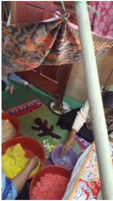
Figura 2 Replika buaya