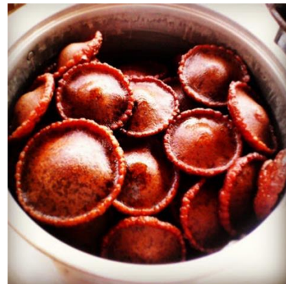
Figura 1 Kuih Penyaram Yang Siap Digoreng

Penyaram dihasilkan daripada adunan tepung beras, tepung gandum, air gula apong. Bahan-bahan yang diadunkan tersebut digoreng dalam kualiti kecil dan dianginkan dalam kualiti menggunakan lidi sehingga ianya mengembuang dan bertukar kepada warna keperangan seperti dalam Figura 1 dibawah.