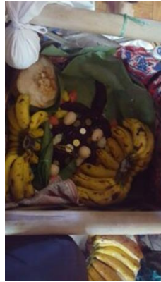
Figura 3 replika buaya II