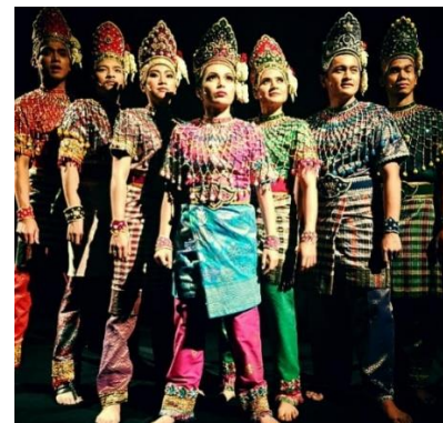
Imej 3: Kostume Watak Anak Raja Besar

Unsur kostume dan tatarias sudah pasti tidak terlepas dari sesebuah persembahan. Penggunaan kostume yang sangat menarik, amat dititik