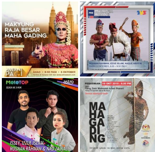
Imej 2: Poster Hebahan MYRMG