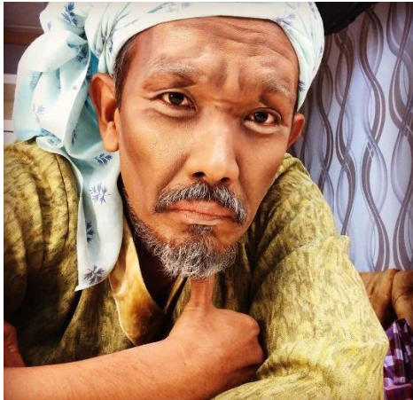
Imej 4: Makeup Watak Tok Peraih Sirih

beratkan oleh pihak Istana Budaya. Penggunaan kostume Pak Yung atau Raja Besar adalah berbeza ketika mempromosikan Mak Yung Raja Besar Maha Gading dengan sewaktu persembahan. Hal ini juga menjadi salah satu daya tarik kepada penonton di mana strategi sebegini dititik beratkan. Selain itu, penggunaan kostume penari dan juga Inang seragam dan cantik sama seperti kostume pemuzik. Mereka memakai pakaian yang seragam dan kemas. Berbeza dengan Mak Yung yang dimainkan di kampung “penggunaan kostume bagi penari adalah seragam namun tidak menonjol sehingga menenggelamkan watak utama. Namun, pemuzik memakai pakaian biasa dan bebas tidak seragam”.