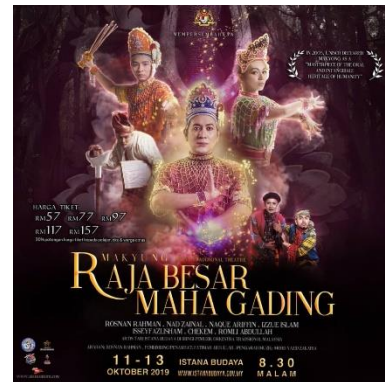
Imej 1: Poster rasmi MYRBMG

merupakan poster rasmi Mak Yung Raja Besar Maha Gading:-